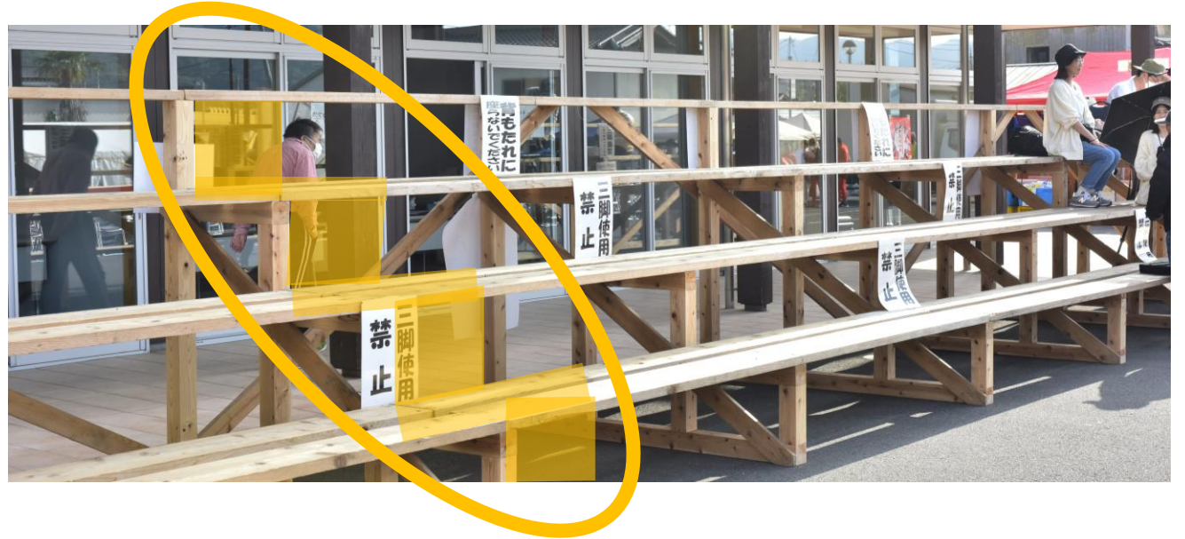
席を正面から見た際のイメージ図（中心からA組⇒W組）

☆特別席：席チケット3枚+2,000円の食券（会場内使用可能）+駐車場（1台分）